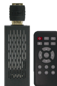
外観は製造時期により、一部異なる場合がございます。