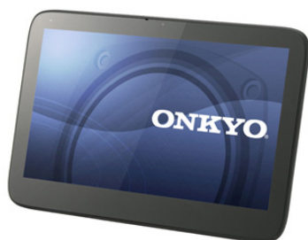
11.6 型ワイド液晶&SSD 搭載 「TW317A7PH」