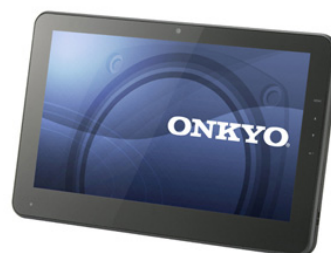
10.1 型ワイド液晶&HDD 搭載 「TW117A6PH」