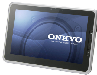
10.1 型ワイド液晶&SSD 搭載 「TW217A5」