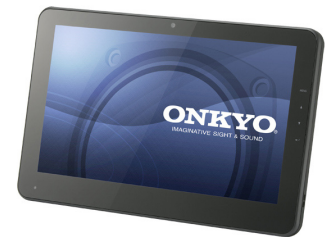
10.1 型ワイド液晶&HDD 搭載 「TW117A4」