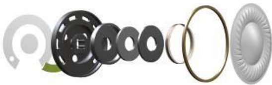
<スピーカーユニット分解図>