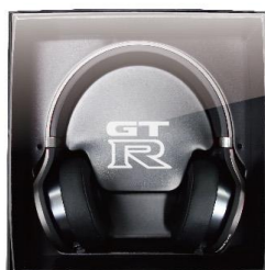
オリジナル パッケージ