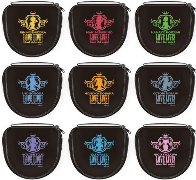
各メンバーモデル専用キャリングポーチイメージ