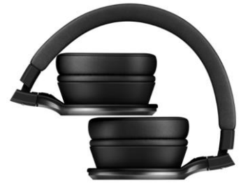
折り畳みイメージ