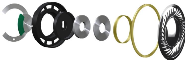
大口径40mmドライバー

ハウジング外部にチャンバー(空気室)を搭載することで、レスポンスの良い低域再生と外部の騒音に対する遮音性能を高めております。また、ハウジングのフロント容積を増やし重低音と空気感を出すことで、クラブフロアにいるような臨場感ある音づくりをしています。