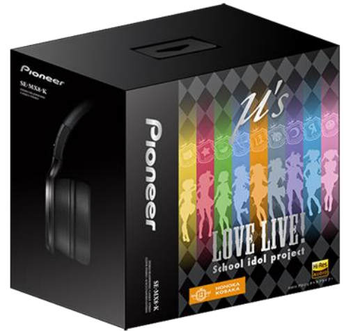
オリジナルパッケージイメージ