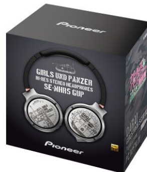
オリジナルパッケージ