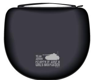
ヘッドホンポーチ