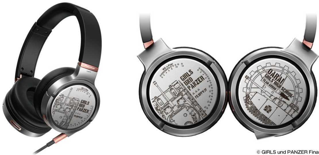
© GIRLS und PANZER Finale Projekt