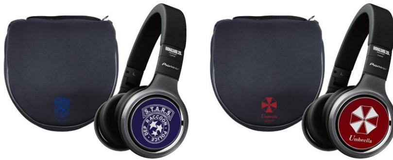
※ 画像は開発中のイメージです。