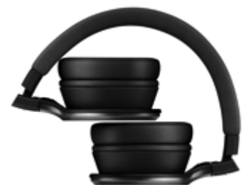
折り畳みイメージ