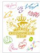
終了画面 (L), (P) 共通