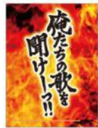
起動画面 XDP-20(L) 用

画面上のボタンをマクロス仕様にデザイン! さらに起動画面や終了画面もオリジナルデザインに!