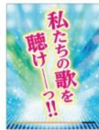
起動画面 XDP-20(P) 用