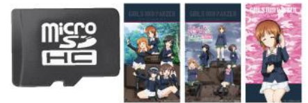
ハイレゾ楽曲、壁紙入り microSD カード(8GB)

©GIRLS und PANZER Film Project ©GIRLS und PANZER Finale Project