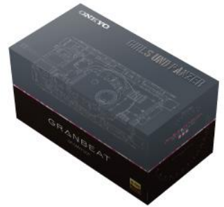
オリジナルパッケージ