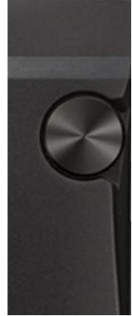
【アルミ無垢材から削り出した筐体】 【側面に配置した操作ボタン】 【ロータリーエンコーダー式ボリュームノブ】