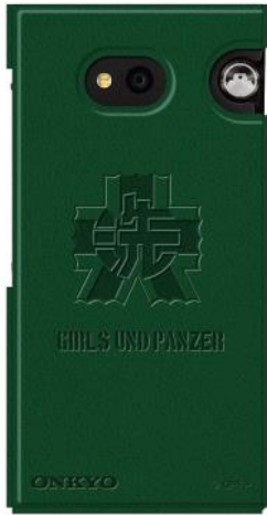
スタンドにもなる専用レザーケース