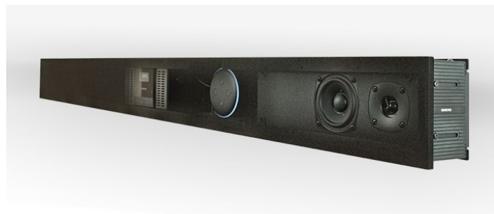
Custom Fit Soundbar

本体部には、カスタマイズに対応できるスペースが設けられており、基本の2chの構成に加え、セリフが聞き取りやすくなるセンタースピーカーが追加できるようになっています。他にも、サウンドバーに搭載できるオリジナルの小型アンプは、HDMI®入力端子や、Bluetooth®対応。スペース内に Amazon Fire TV Stick や Apple TV などストリーミングデバイスを設置すれば、迫力の映像も、良質な音とともに手軽に楽しめます。