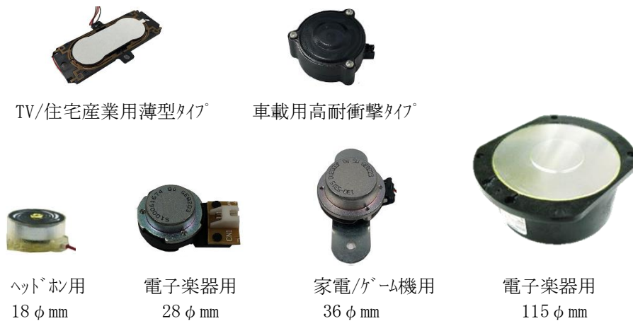
【充実した加振器ラインナップ】

当社はホームAV事業売却により、祖業であるスピーカーコンポーネント事業への回帰を進め、OEM事業に注力することによってあらゆる用途への拡大と業績向上を目指してまいります。