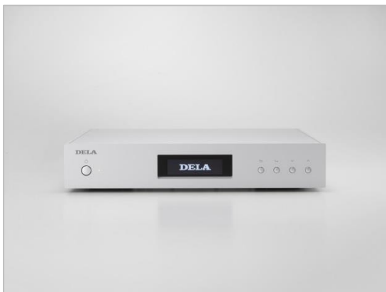
DELA N1 シリーズ

2005年のサービス開始以降、さまざまなジャンルのハイレゾ配信を行い、現在では国内最大級のカタログ数を持つハイレゾ音源配信サイト「e-onkyo music」が、株式会社バッファローのハイレゾ対応デジタルミュージック・ライブラリー「DELA N1 シリーズ」の自動ダウンロードに対応します。