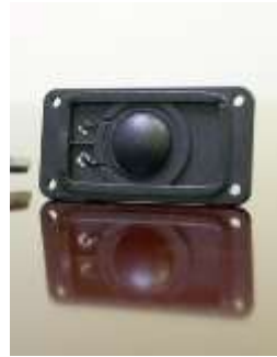
20 mmドームツイーター

当社は今後とも河合楽器との提携により、楽器分野でも当社技術を活かした新しい価値の提案、音の楽しみ方をご提案してまいります。