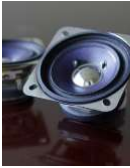
80 mmフルレンジスピーカー